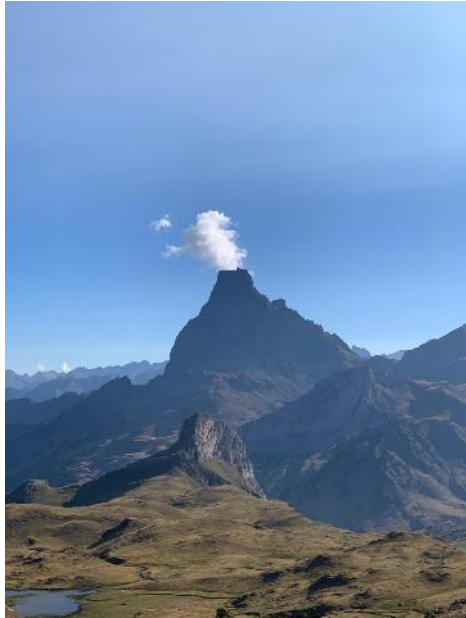
Lainoen erupzioa, mendi bolkanikoan

Batxilergoko lehen saria - 2021 (M.D.Z. - Azkoitia BHI)